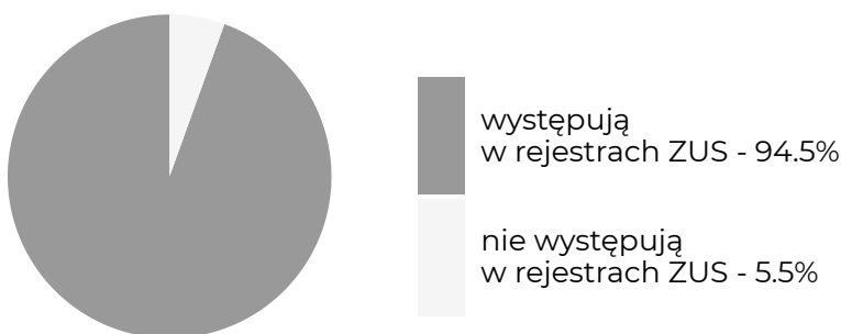
Absolwenci, którzy w okresie objętym badaniem ...